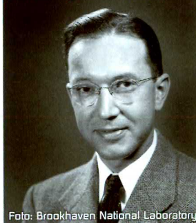
William Higinbotham, 1948

1958, nur 13 Jahre nach dem 2. Weltkrieg, war die Menschheit in Sorge um eine weitere Eskalation und erlebte den kalten Krieg. Die Großmächte probten den Ernstfall, den Druck auf den roten Knopf verband man damals mit dem atomar geführten 3. Weltkrieg. In genau dieser Zeit arbeitete ein junger Physiker namens William "Willy" Higinbotham, welcher auch noch ausgerechnet an der Entwicklung der Atombombe mitgearbeitet hatte, an einem amerikanischen Kernforschungszentrum daran, dem gefürchteten "Druck auf den roten Knopf" eine ganz neue Bedeutung zu geben und erfand das erste interaktive Videospiel.